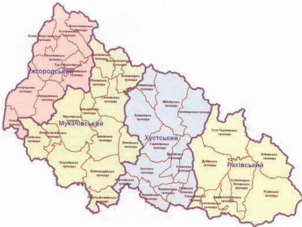
Рис. 2. Проект поділу Закарпаття на чотири райони. Варіант Мінрегіонбуду [7].

офіційний Київ інтенсивно артикулював думку, що всі основні питання життєдіяльності будуть вирішуватись на рівні громад, а район стане базовою одиницею для забезпечення державного нагляду, – місцеві політичні групи боролися за збереження впливу у нових районних конфігураціях. На початку було запропоновано три робочі моделі, перша і друга з яких передбачала поділ на чотири райони, а третя – на три.