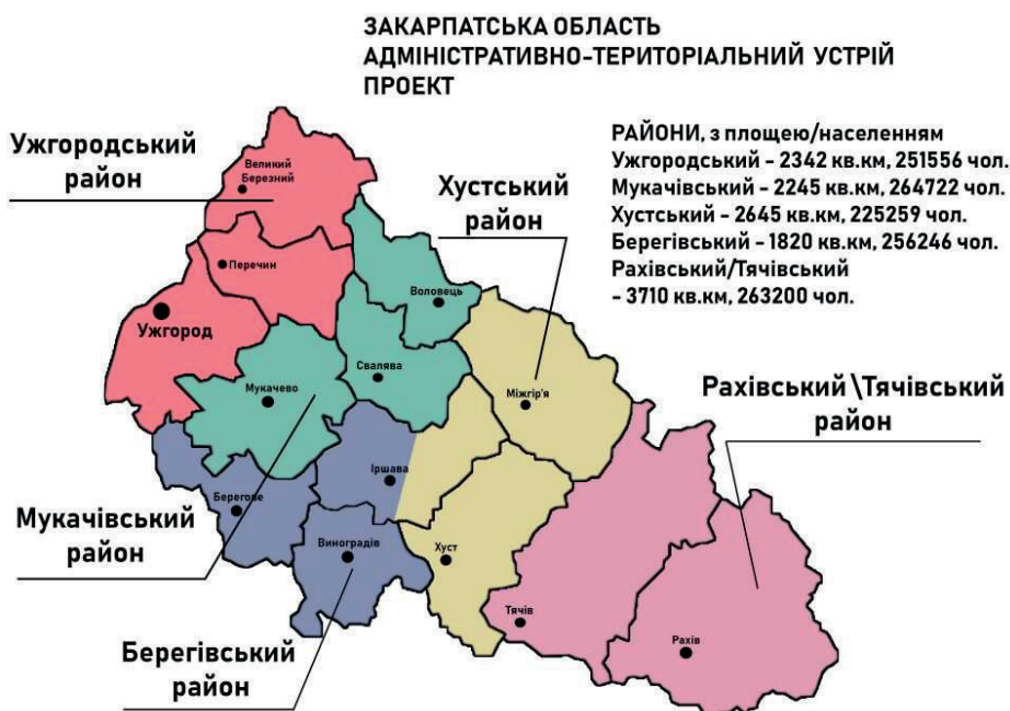
Рис. 6. Модель районування Закарпаття. Автор: А. Панов

бачення нових районів виглядало наступним чином: Ужгородський (Ужгородський, Перечинський, Великоберезнянський райони); Мукачівський (Мукачівський, Свалявський, Воловецький райони); Берегівський (Берегівський, Виноградівський райони, західна частина Іршавського району); Хустський (Хустський, Міжгірський райони, східна частина Іршавського району); Солотвинський (Тячівський, Рахівський райони).