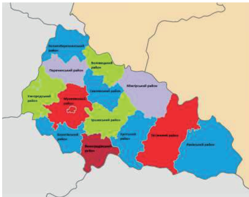
Рис. 1. Райони Закарпаття до 2020 року. Автор: А. Панов

Спробуємо проаналізувати, як нова територіальна система виглядає у контексті Закарпаття. Нагадаємо, що до початку змін Закарпатська область складалася з 5-ти міст обласного значення (які не належали до території районів, хоч переважно виконували роль районних центрів), 13-ти районів, які поділялися на 337 міських, селищних і сільських рад.