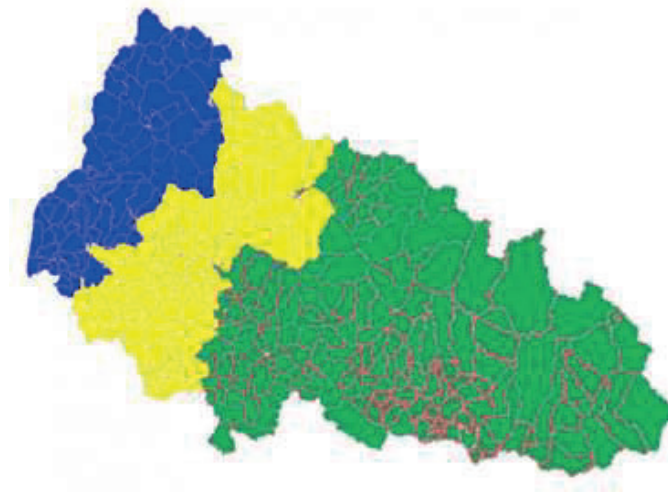
Рис. 4. Проект поділу Закарпаття на три райони. Варіант Мінрегіонбуду [9].

Усі три варіанти містили суттєві диспропорції у плануванні території: зокрема по чисельності населення майбутніх районів, географічних параметрах та економічному потенціалу [10]. Наприклад, у одному із запропонованих варіантів передбачалося утворення Мукачівського району з населенням на 150 000 осіб більше, ніж в Ужгородському. І це при тому, що у відповідності до базової методики утворення одиниць субрегіонального рівня, район можна утворювати, коли в ньому мінімально проживає 150 000 осіб. Тобто різниця у населенні між проектними Мукачівським та Ужгородськими районами сама по собі могла стати фундаментом для ще одного району.