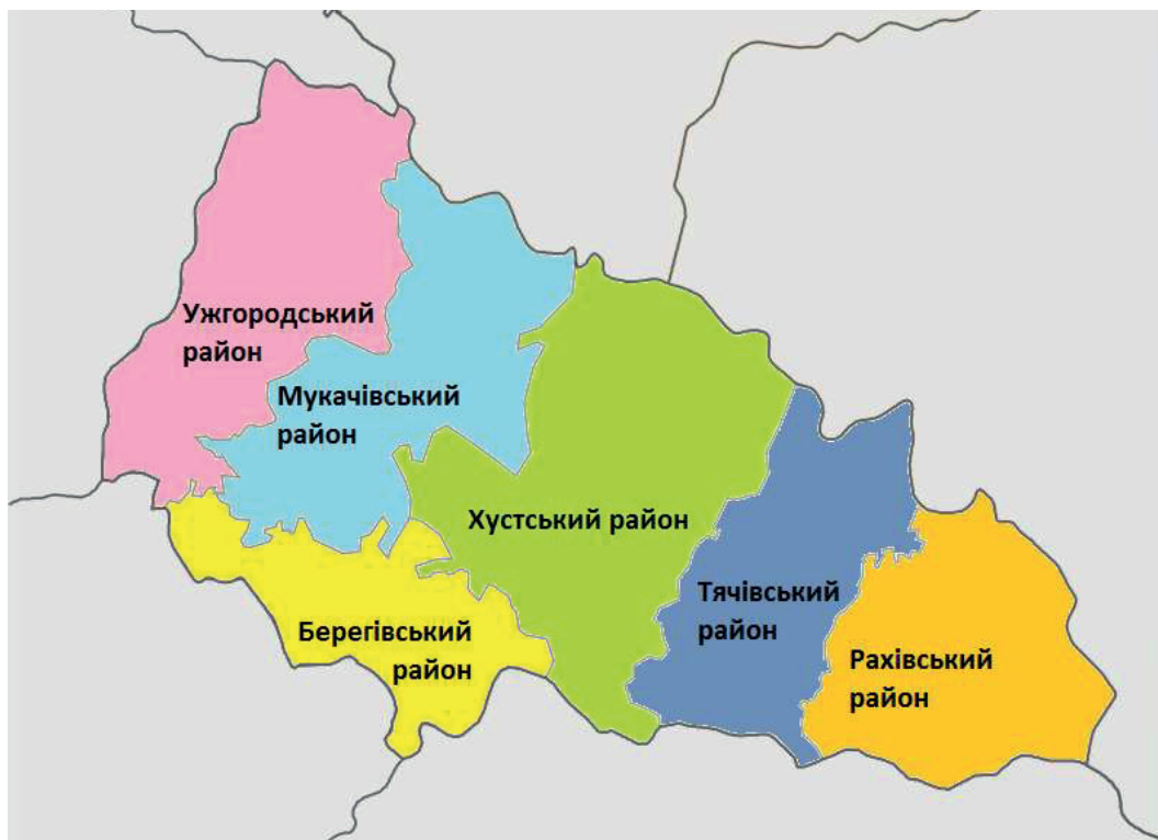
Рис. 7. Нові райони Закарпатської області. Автор: А. Панов

На базовому рівні утворено 64 територіальні громади, які на субрегіональному рівні згруповані у шість районів. Кількість громад у районах є нерівномірною – вона варіюється від чотирьох до чотирнадцяти.