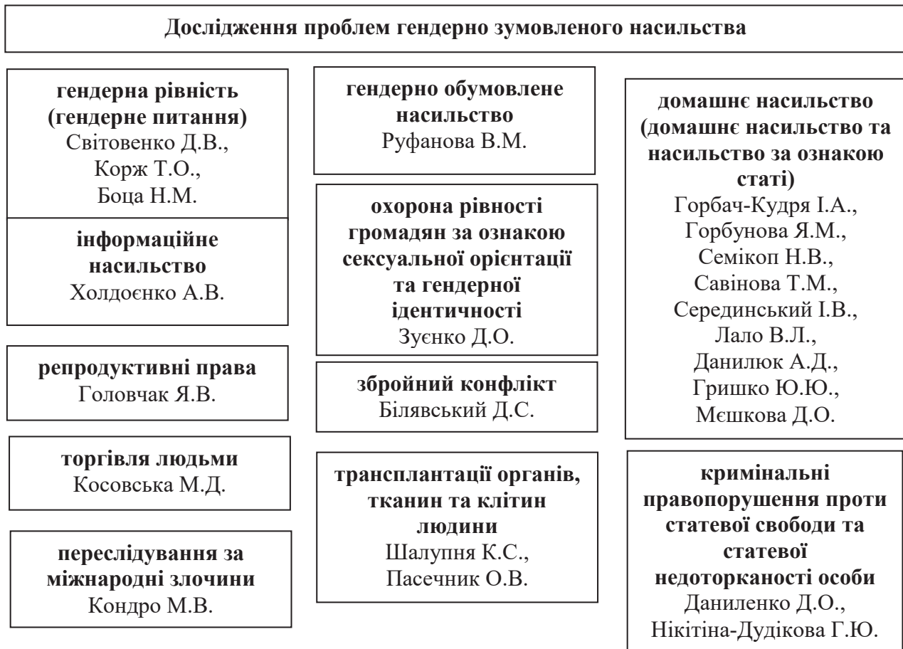
Рис. 2. Структура наукової проблематики гендерно зумовленого насильства, розподілена за напрямками досліджень українських вчених у 2020 році

реалізації ґендерної рівності Національною поліцією України». Зокрема, вченою доведено обґрунтованість і практичну необхідність дотримання міжнародних стандартів та використання Україною передового зарубіжного досвіду реалізації адміністративно-правових механізмів ґендерної політики органами поліції: послідовна криміналізація різних форм насильства за ґендерною ознакою (посилення відповідальності за вчинення насильства, свідком якого є дитина; неможливість уникнення кримінальної відповідальності за вчинення насильства за ознакою ґендера повторно); застосування спеціальних електронних GPS-браслетів з метою відстеження та оперативного реагування на наближення кривдника до потерпілої особи; максимальне залучення громадських формувань до виявлення, запобігання та протидії виявам дискримінації за ґендерною ознакою [4, с. 22].