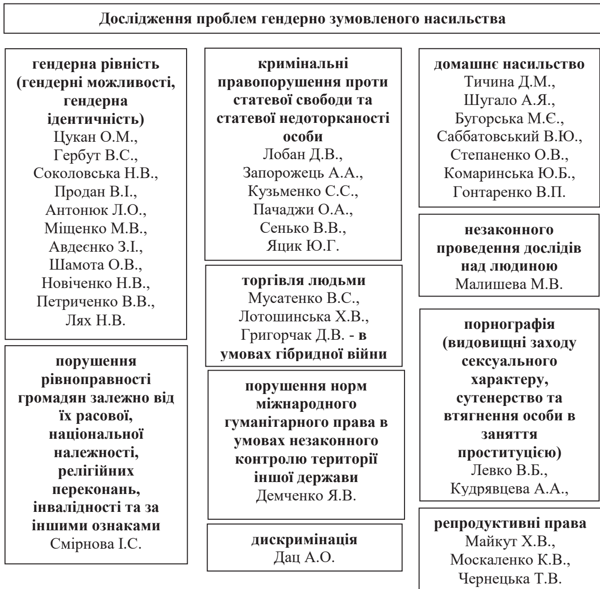
Рис. 3. Структура наукової проблематики гендерно зумовленого насильства, розподілена за напрямками досліджень українських вчених у 2021 році